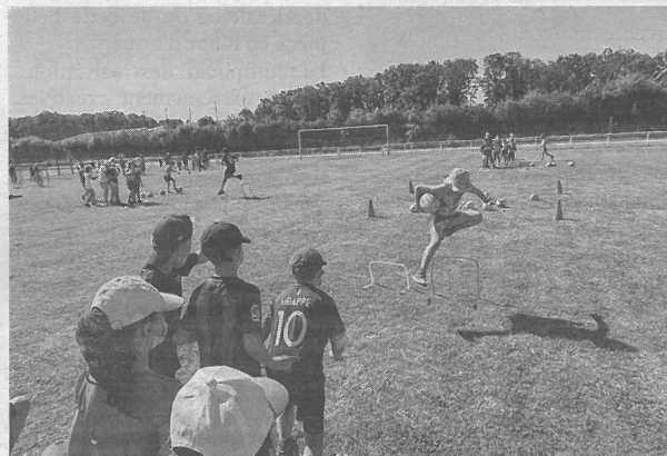
Les 300 élèves ont enchaîné les rotations entre les dix ateliers.

À voir l'enthousiasme de certains pour les exercices, et d'autres pour... la musique crachée par les hauts parleurs, les enfants ont eu l'air d'apprécier.